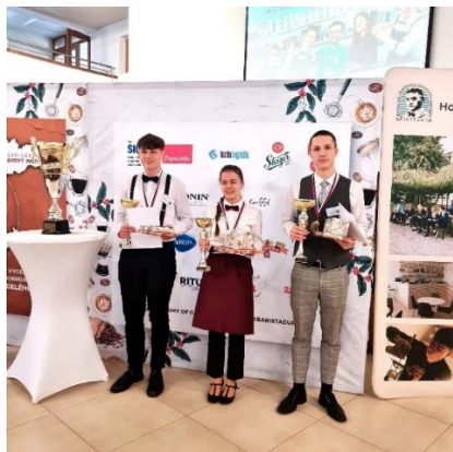
Výherci Piešťanského poháru Ludovíta Wintera