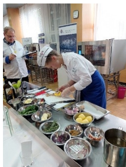
Reprezentantka SŠHS Kroměříž

Úkolem baristů je připravit 2 druhy kávy a soutěž sommelierů se skládá z vědomostního testu a servisu vína.