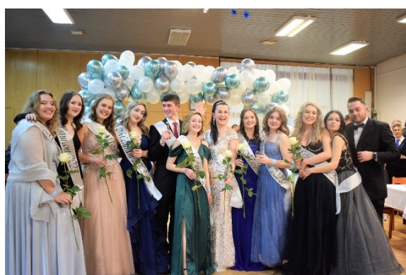
Žáci, kteří se účastnili školního plesu