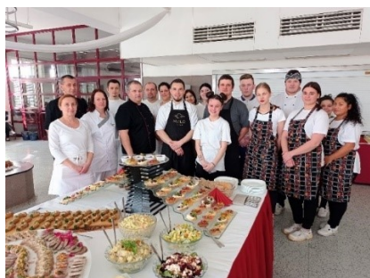
Účastníci kurzu studené kuchyně

Kurz studené kuchyně byl velkým přínosem pro žáky i zaměstnance školy a setkal se s velkým ohlasem.