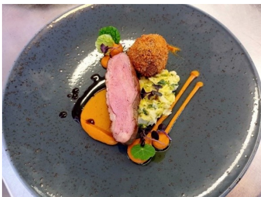
Úprava kachny, jako hlavního chodu