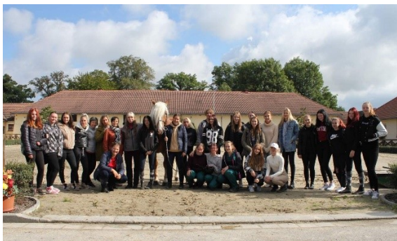
Fotografie žáků oboru jezdec a chovatel koní v hřebčinci Tlumačov

Žáci druhého a třetího ročníku oboru jezdec a chovatel koní se zúčastnili 22. 9. 2022 exkurze v Zemském hřebčinci Tlumačov. Za krásného zářiového počasí viděli Základní zkoušky chladnokrevných hřebců a zahájení 60denního testu.